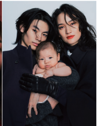
United Arrows HOLIDAYS2023