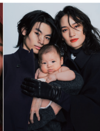
United Arrows HOLIDAYS2023